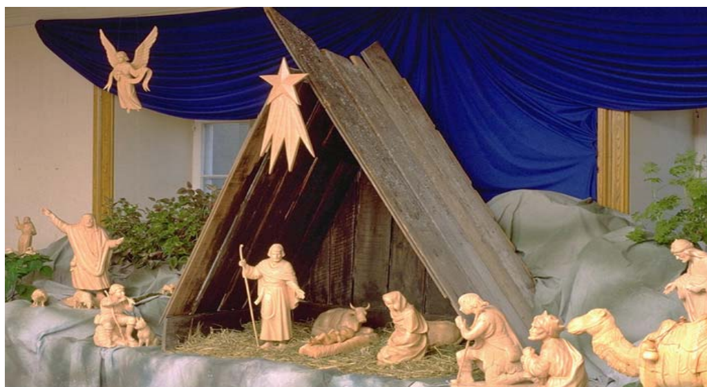
Crèche de l'église de Saint-Jean-Port-Joli composée de 27 personnages et animaux en bois de tilleul. Oeuvres et dons d'une quinzaine de sculpteurs sur bois de Saint-Jean-Port-Joli.

Que la paix et la beauté du temps des Fêtes de Noël et du Nouvel An vous apportent le bonheur, la gaieté et la joie du partage avec tous les vôtres.