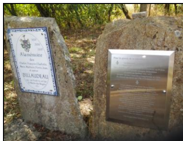
Plaques installées à St-Martin des Noyers, France