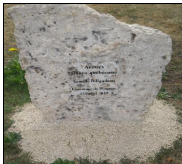
Plaque installée 2012 à La Jarge, Pioussay, France

Pour devenir membre complétez ce formulaire ainsi que la feuille des renseignements généalogiques.