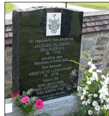
Monument installé dans le Cimetière de St-François, I. O.