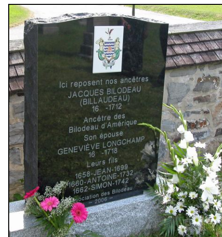
Monument installé dans le Cimetière de St-François, I. O.