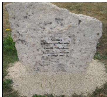
Plaque installée 2012 à La Jarge, Pioussay, France

Pour devenir membre, complétez ce formulaire ainsi que la feuille des renseignements généalogiques.