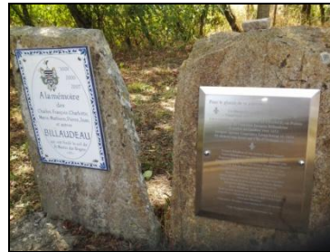
Plaques installées à St-Martin des Noyers, France