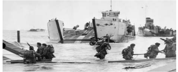
Le 6 juin 1944, nommé sous le nom de jour J, commencent les débarquements alliés sur la côte de Normandie, début de l'opération Overlord

Après le déjeuner, départ pour une journée aux plages du débarquement . Accompagné d'un guide local, vous découvrez Omaha Beach, Arromanches, Juno Beach et le cimetière de Bénvy-sur-Mer , pour un total de 5h de visites. À Arromanches , vous visiterez le musée où des maquettes, des vidéos et un diaporama apportent une image tout en émotions de ce fameux débarquement. Ce musée fut d'ailleurs le premier musée créé sur ce thème au lendemain de la Seconde Guerre mondiale. Dîner libre après la visite. Départ vers Juno Beach pour une balade symbolique sur la plage où ont débarqué, le matin du 6 juin 1944, le 14 e Régiment d'artillerie de campagne canadien. Puis, continuation vers Bénvy-sur-Mer où reposent 2 049 Canadiens, à l'ombre des pins et des érables du cimetière commémoratif canadien. Après ces belles visites, direction Randonnai , dans le Perche . À l'arrivée, installation à l'hôtel (pour 2 nuits) et souper. P.D$.S.