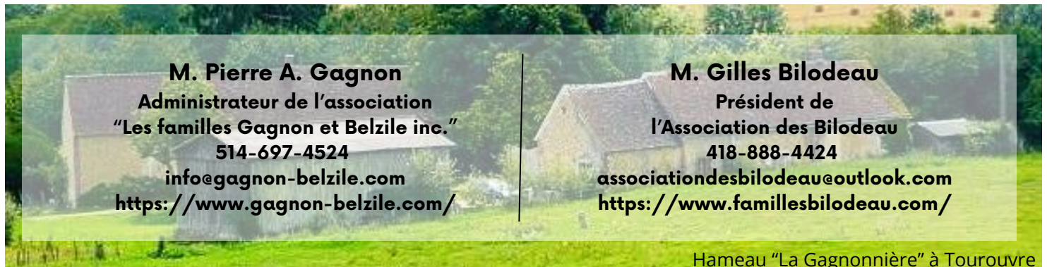
Hameau "La Gagnonnière" à Tourouvre