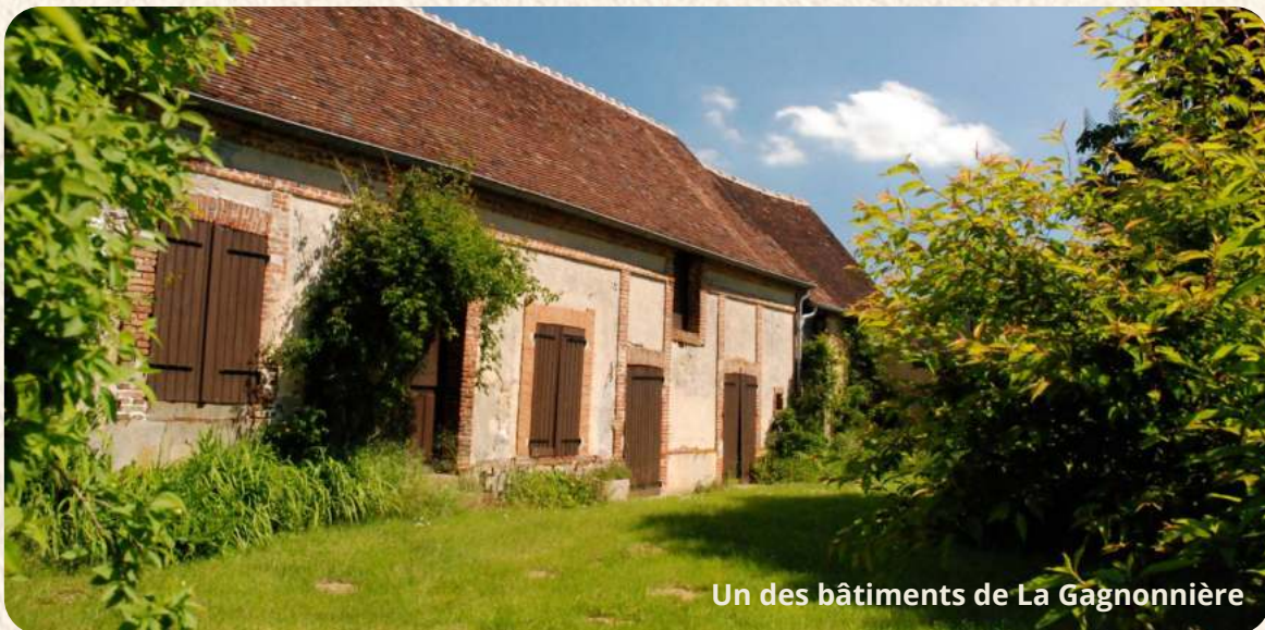
Un des bâtiments de La Gagnonnière